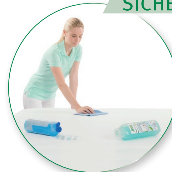
Top-Reinigungsleistung – kein ungewollter Flüssigkeitsaustritt