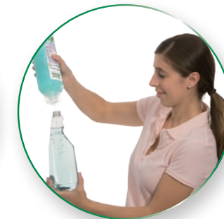
Intuitive Anwendung ohne zusätzliche Dosierhilfen