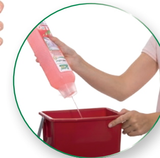
Methoden- und verschmutzungsbezogen dosieren